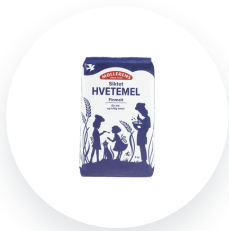
Møllerens Hvetemel siktet